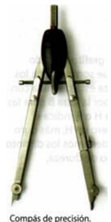
Compás de precisión.

El más adecuado es un compás de precisión , es más manejable, dura más tiempo y los trazados son más precisos. Se caracteriza por una rueda dentada central.